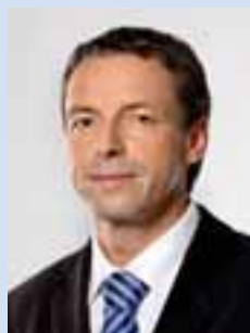
MUDr. Pavel Bém primátor, hlavní město Praha