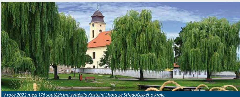
V roce 2022 mezi 176 soutěžícími zvítězila Kostelní Lhota ze Středočeského kraje.

Podmínky soutěže a další potřebné informace najdete na: www.vesnice.roku.cz .