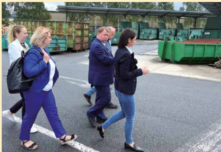
3. den návštěvy: Prohlídka sběrného dvora spravovaná česotřebovskou společností Eko Bi, kde ukrajinská delegace zhlédla způsob třídění odpadů a skládkování