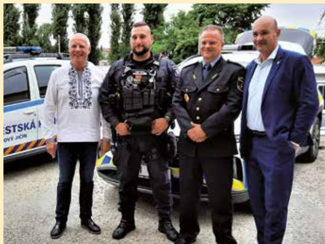
3. den návštěvy: Společné foto zástupců Městské policie v Novém Jičíně se starostou Pavlohradu a starostou Nového Jičína

Hlavním projektem, který si Pavlohradští zástupci připravili pro své české kolegy, bylo vybudování vlastní vodovodní infrastruktury. Jak při prezentaci upřesnili, doposud muzeum Pavlohrad využívá centrální vodovod, v němž se voda musí přečerpávat na pětkrát, což je finančně i energeticky náročné. Voda samotná pochází z řeky Dněpr, která protéká průmyslovými centry i zemědělskými podniky a může se tak do ní dostat ledacos včetně chemikálií z průmyslové výroby či hnojiv ze zemědělství. Samotný místní vodovod, kterým by měla protékat již čistá voda, je zároveň zastaralý a opotřebovaný. Natočit si bez starostí vodu z kohoutku proto na Ukrajině neznají. V Česku a dalších zemích EU je díky unijním