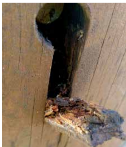
Degradace v místě kolíkového spoje – rozhledna