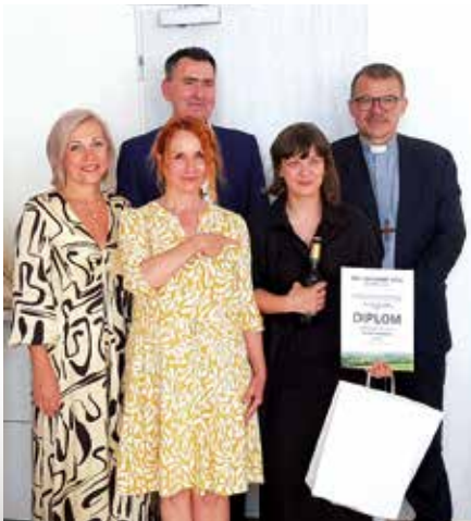
1. místo města

Další informace k soutěži naleznete také na adrese www.civipolis.cz .