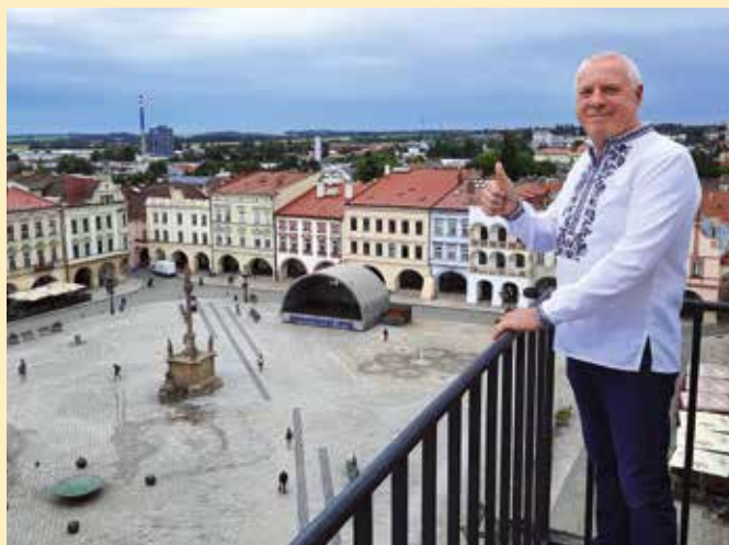
3. den návštěvy: Vyhlídka z novojičínské radnice na čtvrccové náměstí s tyčickým podloubím – na fotografii starosta Pavlohradu

odpadového hospodářství, kterou má na starosti soukromá firma. Zástupci Pavlohradu dále navštívili místní sportoviště – sportovní halu, zimní stadion a atletický stadion s fotbalovým hřištěm s umělým trávnikem – a dozvěděli se, že ve městě lze realizovat skutečně veškeré druhy sportů včetně kuželek (které nejsou totéž co bowling) nebo ledního hokeje, který se zde trénuje i v letních měsících. Komplexností sportovního vyžití v Novém Jičíně byla ukrajinská delegace ohromena, přestože ve čtyřikrát větším Pavlohradu mají téměř 360 sportovišť.