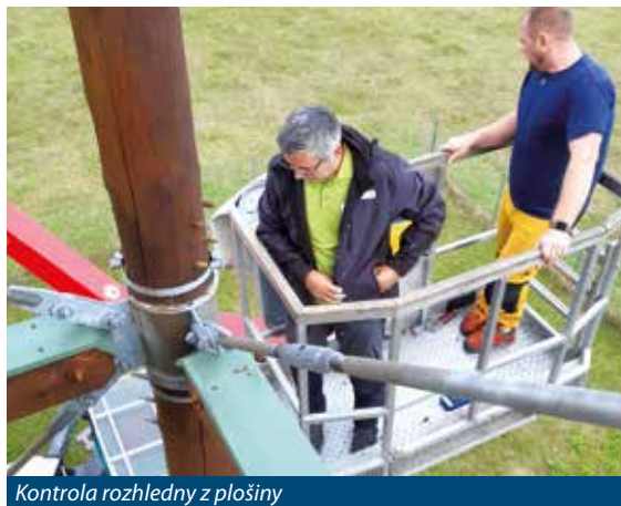
Kontrola rozhledny z plošiny

Jedna rozhledna byla ve velmi dobrém stavu. Druhá byla na první pohled také v pořádku, ale ukázalo se, že konstrukční řešení spojů u této rozhledny umožňovalo vodě a vlhkosti, aby pronikala dovnitř sloupů. Kritickými body byla zejména místa krytých šliců pro kování, do kterých voda zatékala některými výsušnými trhlinami ve sloupech.