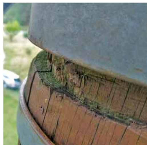
Detail spodní části sloupu ve spoji – rozhledna