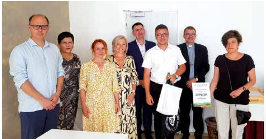
1. místo obce