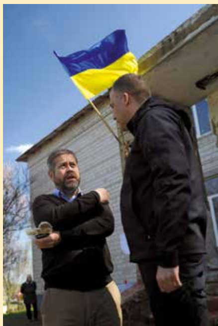
Diskuse se starostou obce Andriivka o potřebách obnovy poničené obecní infrastruktury

Zahraniční komise Svazu se věnuje tématu zahraniční rozvojové pomoci již dlouhodobě. Asi největším počinem z nedávné minulosti je organizace projektu „Odolná samospráva a veřejná správa v zemích Východního partnerství“, jehož cílem bylo podpořit odolnost samospráv prostřednictvím přenosu zkušeností mezi zástupci obcí z EU a zemí Východního partnerství. Tohoto komplexního projektu v rámci českého předsednictví se zúčastnila, kromě zástupců samospráv z Moldavska a Gruzie, také početná delegace starostek a starostů z Ukrajiny.