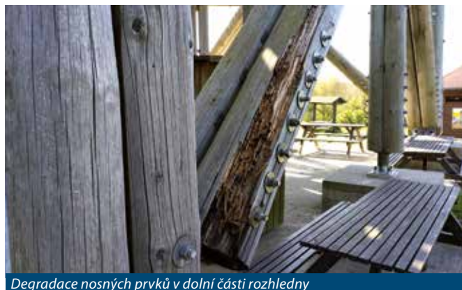
Degradace nosných prvků v dolní části rozhledny

na hlavní body tak, aby stavba plnila svůj účel co nejdéle.