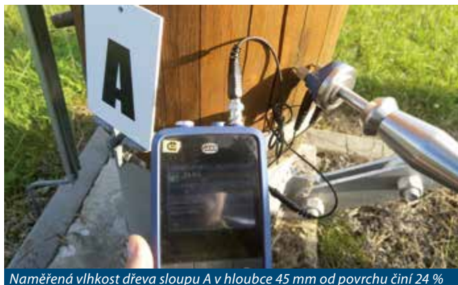
Naměřená vlhkost dřeva sloupu A v hloubce 45 mm od povrchu činí 24 %