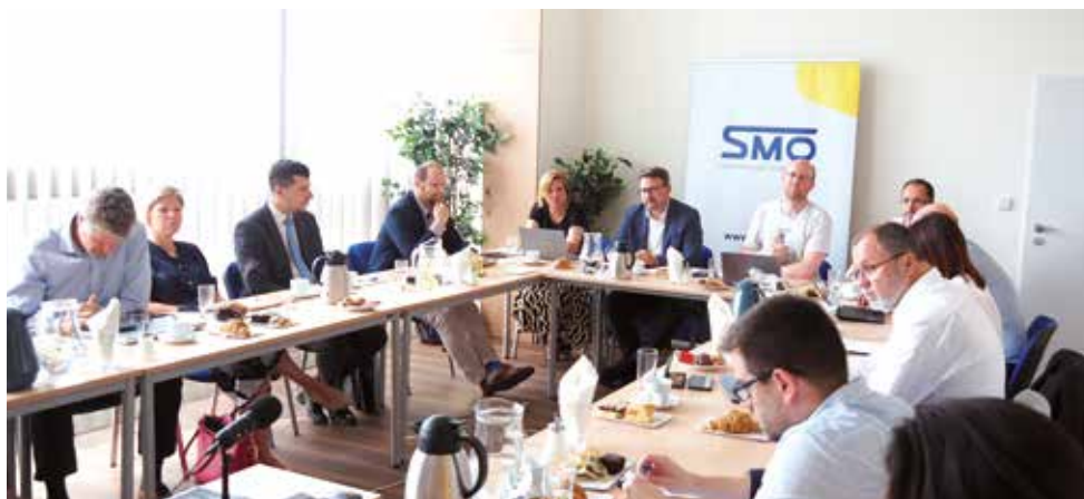
Z jednání PS konaného 22. června 2023