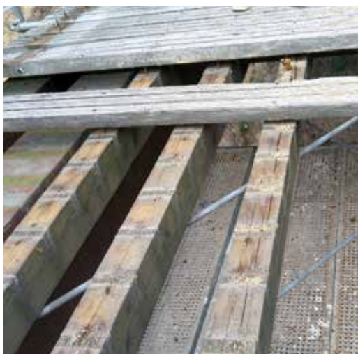
Nosné podélníky pod dubovou mostovkou degradují

Cílem techniků je, aby dřevěné konstrukce ve veřejném prostoru sloužily bezpečně, dobře a dlouho. Jejich preventivní kontrola a údržba jsou nástrojem a nutným předpokladem jejich ochrany.