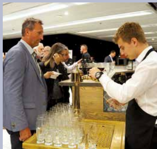
Energetická konference, Praha 12. a 13. října 2023