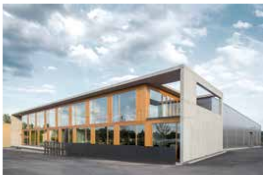
Administrativní budova společnosti Brusivo, Rokycany (Zábran Nová architekti)

Územní rozvoj by měl řešit všechny typy dopravy, tedy silniční, leteckou, železniční a vodní, se zaměřením na celkové zefektivnění a rozvoj různých forem veřejné dopravy. Znamená to také řešit rychlé a efektivní propojení se sousedními státy,