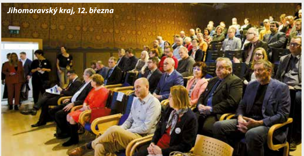
Jihomoravský kraj, 12. března