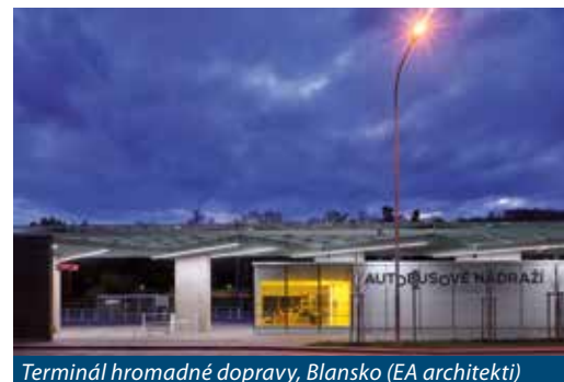
Terminál hromadné dopravy, Blansko (EA architekti)

krátkých vzdáleností se zklidněním dopravy a současně s dostatkem veřejné zeleně. U větších měst se předpokládá posilování funkcí občanské vybavenosti v lokálních centrech, což by mimo jiné ulehčilo dopravě uvnitř města. U bydlení půjde o úspornější a efektivnější využívání pozemků, bude vhodné přijít s novými formami kvalitního bydlení, u rodinných domů častěji upřednostňovat řadovou zástavbu typickou často i pro venkov, kobercovou zástavbu atriových domů apod. Užitkové zahrady pro drobné pěstitele by měly být dostupné také ve větších sídlech. Občanská vybavenost by měla být rovnoměrně rozmístěna bez zbytečné kumulace pouze v některých lokalitách měst. Efektivněji lze využívat i území často rozsáhlých ploch dopravní infrastruktury nebo průmyslových nemovitostí.