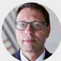
Michal Černý ředitel odboru předškolního a základního vzdělávání MŠMT