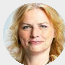
Zdislava Odstrčilová vrchní ředitelka sekce rodinné politiky a sociálních služeb MPSV