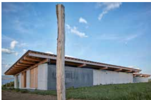
Vinařství Přátel Pavlova (OK Atelier, Atelier Štěpán)

dou renovovány zejména školy a nemocnice. Předpokládá se také delší technická životnost staveb, jejich snadnější opravitelnost a výměna stavebních prvků s kratší životností. Budovy by měly umožňovat snadnější změny funkčního využití, což rovněž souvisí s pružnějším územním plánováním. Pro územní rozvoj z toho může vyplývat také menší potřeba nových rozvojových ploch a intenzivnější využívání brownfields v zastavěném území. Současně je třeba zachovat kvalitu veřejných prostranství ve městech s dostatkem zeleně.