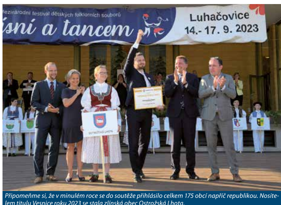
Připomeňme si, že v minulém roce se do soutěže přihlásilo celkem 175 obcí napříč republikou. Nositelem titulu Vesnice roku 2023 se stala zlínská obec Ostrožská Lhota.

je digitální, což výrazně urychlí práci představitelům obcí i hodnotitelům. Inovace v malých obcích resort podpoří v krajském kole novou fialovou stuhou. Plánuje také navýšit odměny formou dotace pro stuhu a ocenění v gesci MMR. V neposlední řadě se také vylepšuje a sjednocuje systém hodnocení.