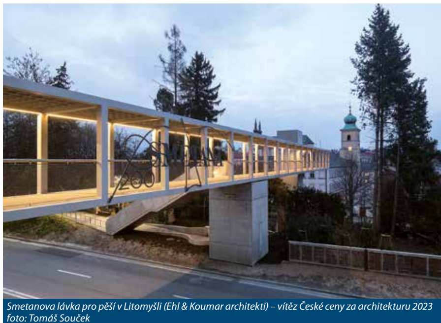
Smetanova lávka pro pěší v Litomyšli (Ehl & Koumar architekti) – vítěz České ceny za architekturu 2023