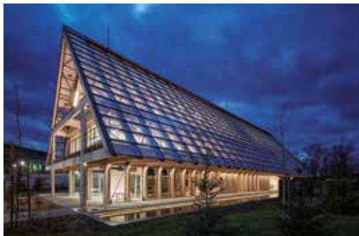
Sídlo Kloboucké lesní, Brumov-Bylnice (Mjölke architekti) – finalista České ceny za architekturu 2023