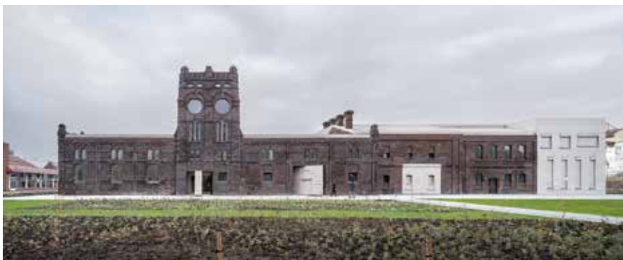
Rekonstrukce bývalých jatek pro galerii Plato, Ostrava (KWK Promes) – finalista České ceny za architekturu 2023.

použitých výrobků. Důležité bude také snížení objemu odpadů a využívání lokálních zdrojů v průmyslové výrobě. Významnou roli bude hrát kromě nových obchodních modelů také digitální technologie, AI, 3D tisk apod. V územním rozvoji bude nadále velmi důležité správné umístění průmyslových a logistických areálů, jejich poloha vzhledem k ostatním funkčním plochám sídel a ohleduplné umístění v krajině. Situování areálů průmyslové výroby a logistiky nemůže probíhat živelně, vhodné může být sloučení několika funkcí, umístění těchto areálů v zeleni, minimalizace potřeb vnějších zdrojů energie či optimalizace napojení na dopravní infrastrukturu. Střechy průmyslových budov budou využity pro fotovoltaiku, vegetaci nebo pěstování zemědělských komodit. Žádoucí bude minimalizovat prostorové požadavky, stavět jen to, co je skutečně potřeba, což právě nové technologie budou umožňovat.