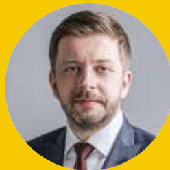
Mgr. Vít Rakušan 1. místopředseda vlády ministr vnitra