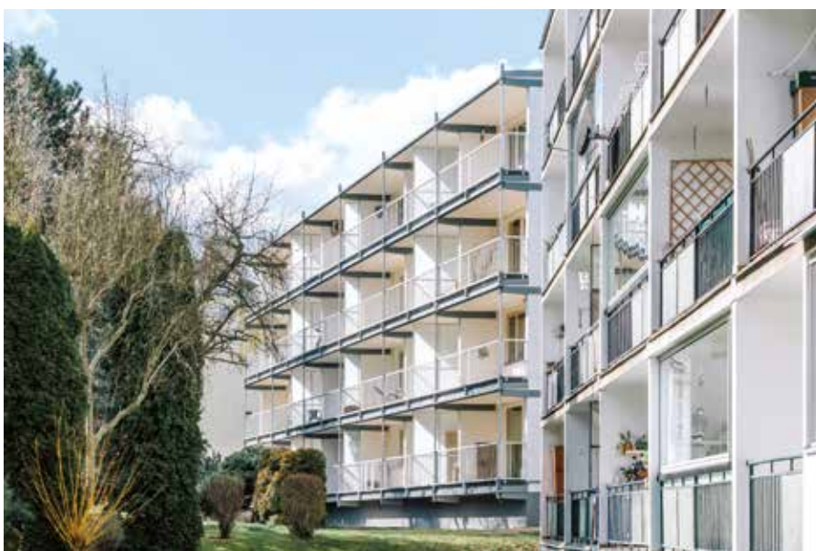
Rozšíření lodžii panelového domu, Praha (re:architekti) – finalista České ceny za architekturu 2023

použitých výrobků. Důležité bude také snížení objemu odpadů a využívání lokálních zdrojů v průmyslové výrobě. Významnou roli bude hrát kromě nových obchodních modelů také digitální technologie, AI, 3D tisk apod. V územním rozvoji bude nadále velmi důležité správné umístění průmyslových a logistických areálů, jejich poloha vzhledem k ostatním funkčním plochám sídel a ohleduplné umístění v krajině. Situování areálů průmyslové výroby a logistiky nemůže probíhat živelně, vhodné může být sloučení několika funkcí, umístění těchto areálů v zeleni, minimalizace potřeb vnějších zdrojů energie či optimalizace napojení na dopravní infrastrukturu. Střechy průmyslových budov budou využity pro fotovoltaiku, vegetaci nebo pěstování zemědělských komodit. Žádoucí bude minimalizovat prostorové požadavky, stavět jen to, co je skutečně potřeba, což právě nové technologie budou umožňovat.