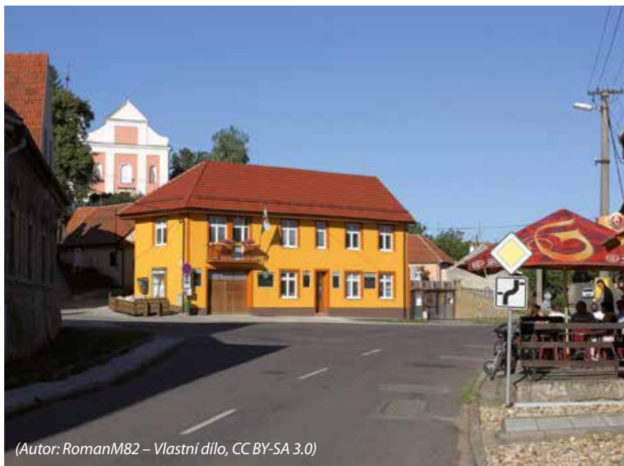
(Autor: RomanM82 – Vlastní dílo, CC BY-SA 3.0)