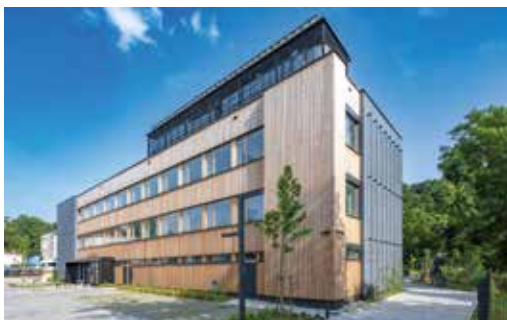
Revitalizace školy Českobrodská, Praha (ECOTEN a Pavel Šulc)