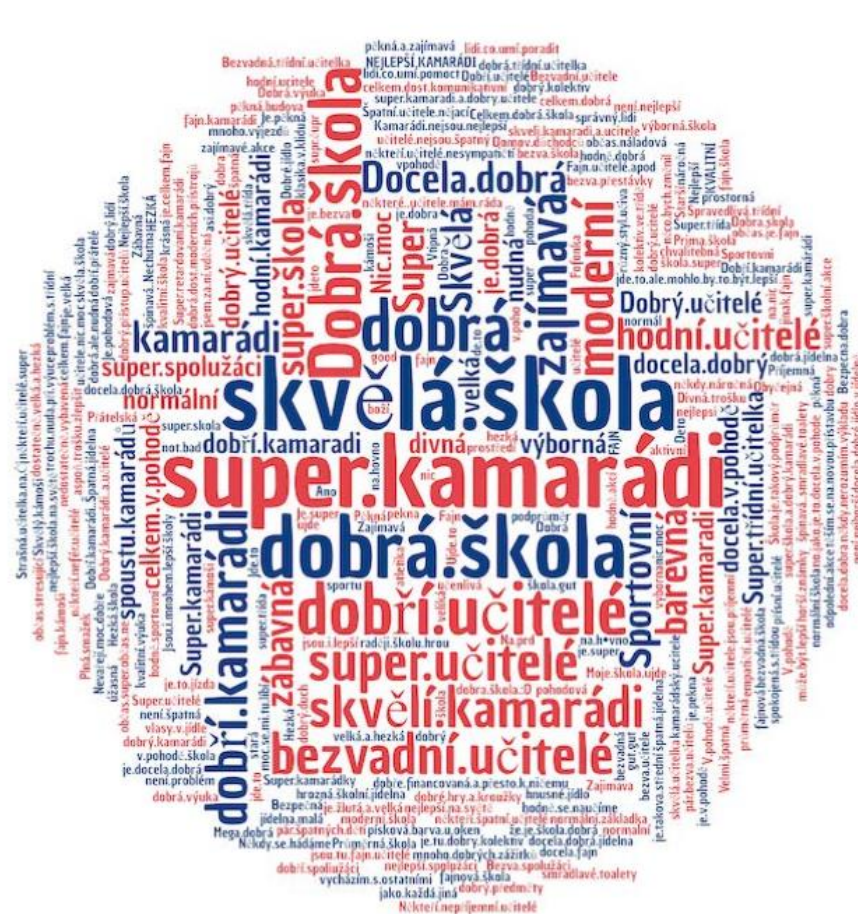
Wordcloud „celkové vnímání školy“, 2020.