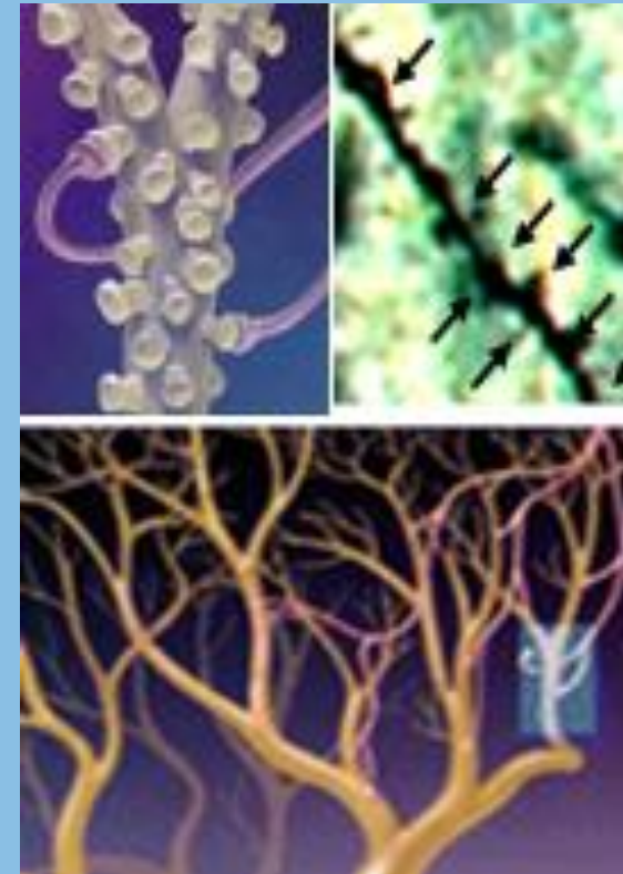
Hodně pohybové aktivity hustá neurální síť