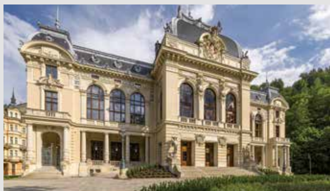
Císařské lázně v Karlových Varech