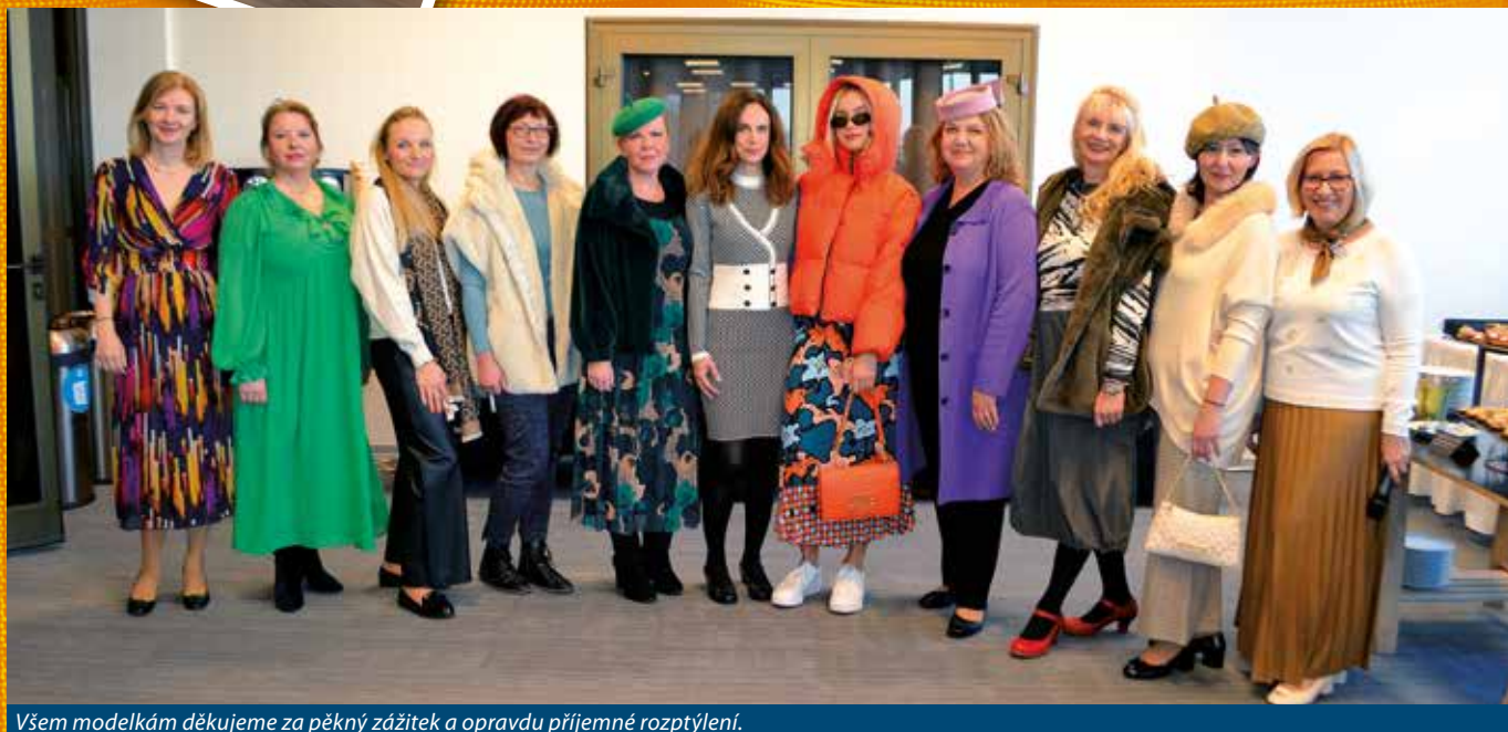
Všem modelkám děkujeme za pěkný zážitek a opravdu příjemné rozptýlení.

Z módní přehlídky konané při Setkání starostek, Praha 27. 11. 2024