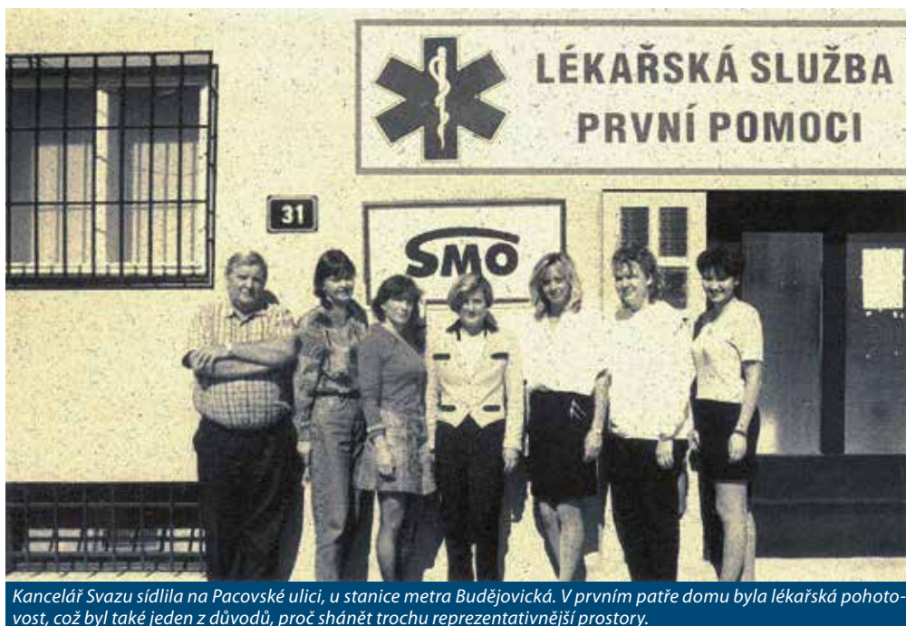
Kancelář Svazu sídlila na Pacovské ulici, u stanice metra Budějovická. V prvním patře domu byla lékařská pohotovost, což byl také jeden z důvodů, proč shánět trochu reprezentativnější prostory.

Z pohledu Svazu jako celku byly klíčové určitě roky 2004 a 2005, kdy se Svaz stal povinným připomínkovým místem a podepsal významnou dohodu o vzájemné