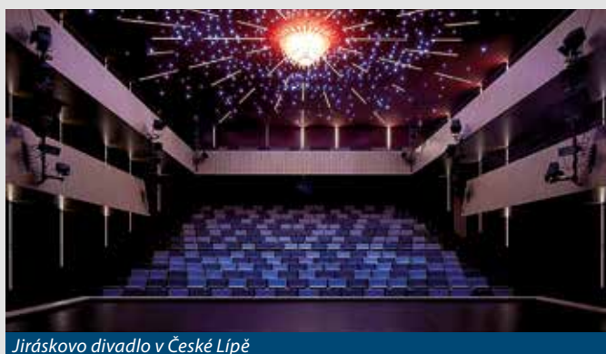
Jiráskovo divadlo v České Lípě