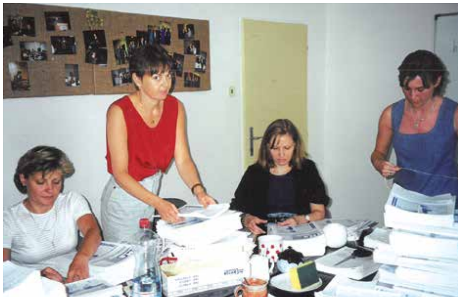
Rozesílání INS nebyla žádná sranda. Tiskli jsme štítky s adresami, ty potom lepili na jednotlivé výtisky, podle poštovních uzlů tvořili balíčky a nakonec vše naložili do auta a odváželi na poštu.

Hlavní smysl zpravodaje byl tedy jasný – dát členům Svazu vědět především o činnosti a závěrech ze zasedání svazových orgánů, tedy Sněmu, Rady, Představenstva, komisí, pracovních skupin, a představitel jejich členy. Informační servis podával krátké zprávy z jednání vedení Svazu s ministry či jejich náměstky, ale i s dalšími významnými státními i zahraničními politiky. Našli bychom v něm různá zamýšlení – názory starostů, ať už k otázkám týkajícím se životního prostředí, privatizace energetických a plynárenských podniků, vzdělávacích aktivit, pomoci hendikepovaným občanům atd. Samozřejmě nechyběla oblast legislativy a financí. Úkolem zpravodaje bylo rovněž upozorňovat na sva-