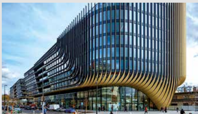
Administrativní budova Masaryčka

Bylo uděleno i několik zvláštních cen. Například od Senátu nebo ministerstev pro místní rozvoj, průmyslu a obchodu, dopravy, kultury, životního prostředí a řady dalších. Jednu uděloval i Svaz měst a obcí. Ten ocenil Dům kultury Letohrad.