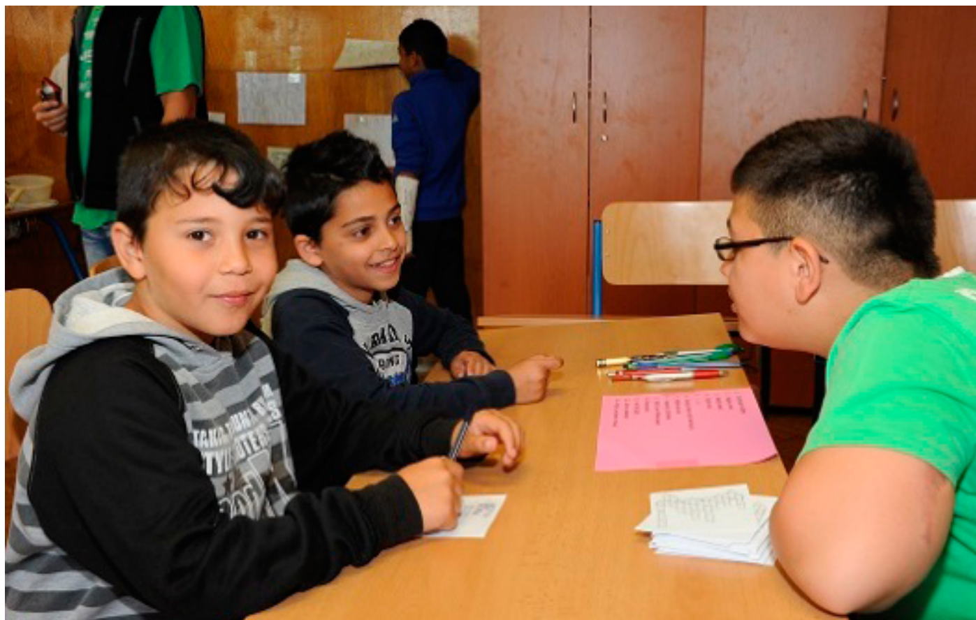
Vrstevníkové vyučování na ZŠ Trmice

Možnosti nových šablon jsme zatím nevyužili. Jsme totiž zapojeni do více projektů a upřesňujeme si nyní korelaci našich potřeb s možnostmi, které tyto projekty přinášejí. Jednak proto, aby tato podpora naší práce ve prospěch žáků byla co nejefektivnější, jednak proto, aby nedošlo k dvojímu financování. Do výzvy šablony se však v brzké budoucnosti zapojíme,