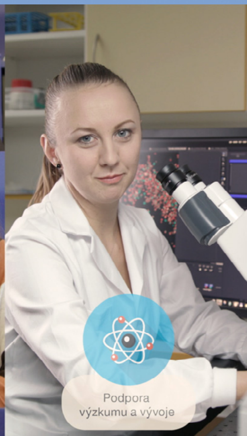
Podpora výzkumu a vývoje