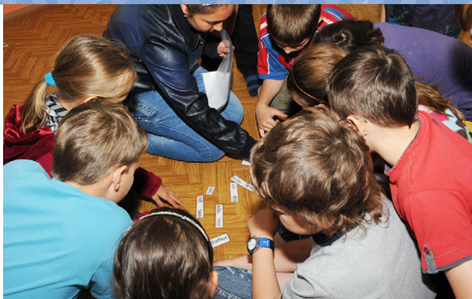
Práce ve skupině

Ano, navázali jsme několik velmi cenných „školních“ partnerství. Předávání zcela konkrétních zkušeností mezi školami vnímám jako hodně užitečné. Předpokládá to však vzájemnou otevřenost a důvěru.