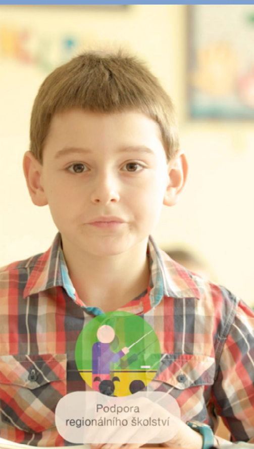
Podpora regionálního školství