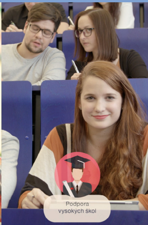
Podpora vysokých škol