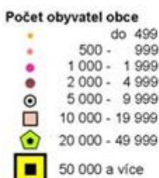
Správní obvod Chomutov obecně-geografická mapa