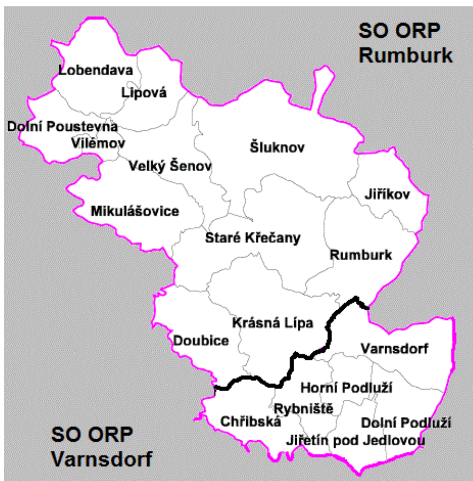
Mapa č. 1: Šluknovský výběžek, rozdělený na SO ORP Rumburk (DSO Sever) a SO ORP Varnsdorf (DSO Tolštejn)

Nastavení legislativních, organizačních a finančních podmínek, personální obsazení a kvalifikační předpoklady pracovníka - to vše bude nyní na programu pravidelných schůzí Svazku obcí Sever, Svazku obcí Tolštejn a Sdružení pro rozvoj Šluknovska (SPRŠ), o němž starostové v obou SO ORP uvažují jako o vhodném nositeli projektu, jehož výstupem by byl vznik poradenského pracoviště.