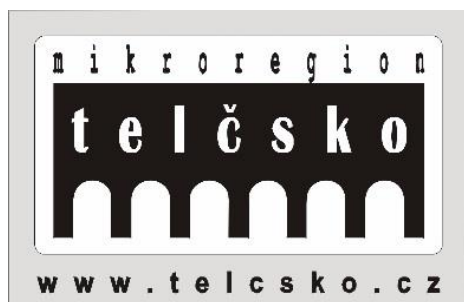
Obrázek č. 1: Logo DSO Mikroregionu Telčsko

V případě prezentace území mikroregionu Telčsko, jež má oslovit širokou veřejnost se všemi kulturními a přírodními atraktivitami i mimo SO ORP Telč vznikla značka Region Renesance . Jedná se o neformální propojení mikroregionů Telčsko, Třeštsko, Jemnicko, Dačicko a rakouského mikroregionu Zukunftsraum. Toto uskupení mikroregionů, které spolupracuje na mnoha projektech společně má i své webové stránky www.regionrenesance.cz , společně se prezentují na veletrzích HOLIDAY WORLD, REGIONTOUR atd.